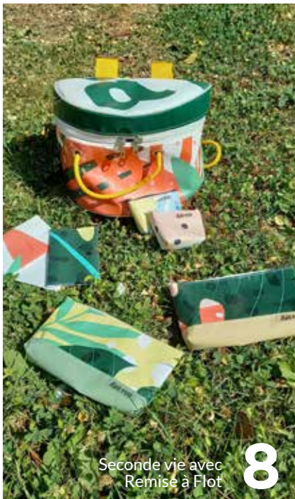
Seconde vie avec Remise à Flot

La Boussole au plus près des jeunes Les différents dispositifs d'accompagnement