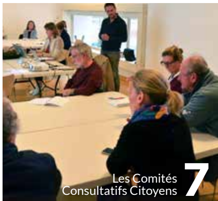
Les Comités Consultatifs Citoyens