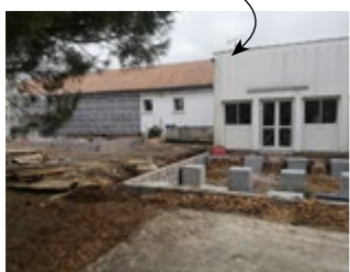
Travaux de la cantine et Rasé de l'école de Rompsay

Enfin, nous souhaitons également sortir de l'énergie gaz pour chauffer nos bâtiments et étudions la faisabilité de l'implantation d'un réseau de chaleur urbain (biomasse).