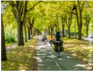
Le canal de Rompsay