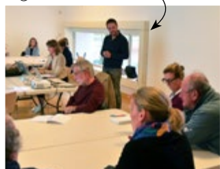
Premier comité consultatif citoyen sur l'écologie

• Nous agissons avec l'ensemble des acteurs liés à l'enfance pour favoriser l'émergence de projets en co-éducation, à l'instar de notre démarche sur la Charte de la Pause Méridienne qui doit s'achever en 2022. Nous avons obtenu la labellisation Information Jeunesse et avons décidé d'aller à la rencontre des jeunes de notre commune via un projet d'information jeunesse itinérant . Nous avons également investi dans du matériel informatique pour favoriser l'accessibilité numérique.