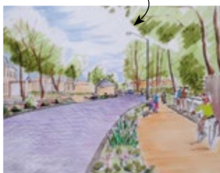
Projet de piste cyclable rue du Château