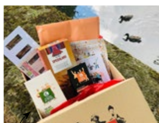
Les cadeaux de mariage en partenariat avec Artisans du Monde