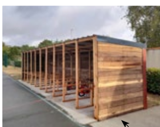
Abris à vélos de l'école de Rompsay par La Matière