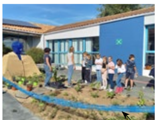
Désimperméabilisation de la cour de l'école des Coureilles