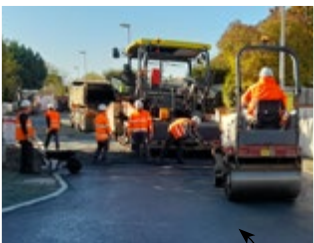
Travaux rue du Stade

Ces travaux seront partagés avec les habitants, quartier par quartier, lors de balades urbaines qui se dérouleront courant 2022.