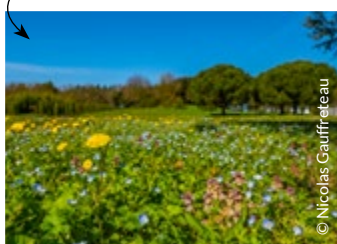
Le parc de Palmilud