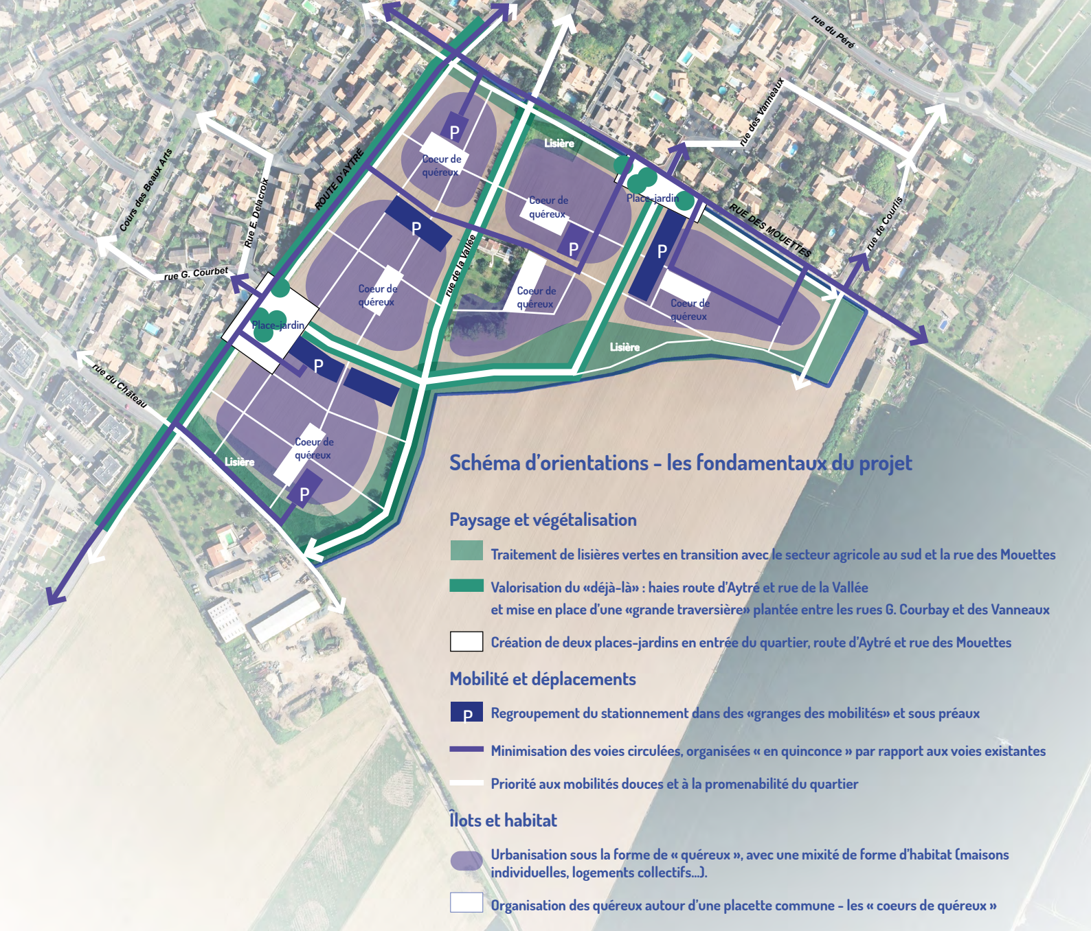
Schéma d'orientations - les fondamentaux du projet