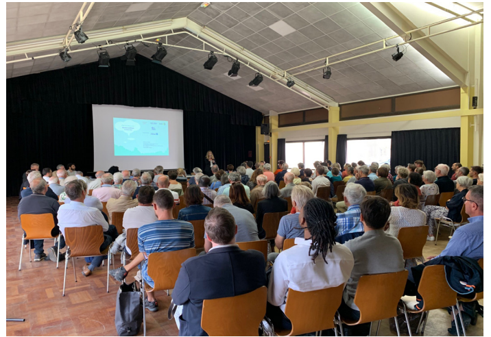
Présentation en plénière de l'aménagement Fief de Beauvais